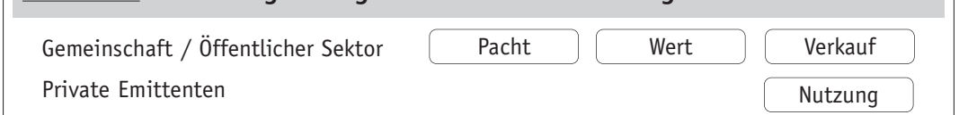
ABBILDUNG 4: Verteilung der Eigentumsrechte im CAR-Regime

Damit liegt die Frage auf der Hand, warum die westlichen Industrieländer sich freiwillig auf die Systemalternative CAR einlassen sollten, wenn sie doch offensichtlich der Nettozahler sein werden. Bei näherer Betrachtung liegt das CAR-Regime jedoch auch in ihrem Interesse. Sie würden einer Illusion aufsitzen, wenn sie annähen, dass ihre Handlungsalternativen darin bestünden, für den Klimaschutz mehr oder weniger zu bezahlen. In Wirklichkeit gibt es kein „weniger“; das „Mehr“ steht bereits fest. Es geht lediglich darum, an wen und für was (und vorzugsweise durch wen) das „Mehr“ bezahlt wird. Fahren die westlichen Industrieländer mit ihrem „business as usual“ wie in der Vergangenheit fort, bedeutet dies nicht nur die Zahlung höherer Ressourcenrenten (Ölpreisanstieg) an die Feudalcliquen im Nahen Osten, sondern impliziert auch höhere Ausgaben für weitere Maßnahmen des nachsorgenden Umwelt- und Gesundheitsschutzes sowie für den Schutz gegen und die Reparatur der Folgeschäden des Klimawandels. Letzteres beinhaltet (u.a. wegen der fortschreitenden Desertifikation und Wasserknappheit) Flüchtlingsströme, zu erwarten sind auch zunehmende politische und militärische Konflikte um das immer knapper werdende Gut Wasser und andere in hohem Maße verbrauchte Ressourcen. Selbstverständlich sind Art und Ausmaß der exemplarisch benannten Folgeschäden höchst unsicher. Von einem ökonomischen Standpunkt